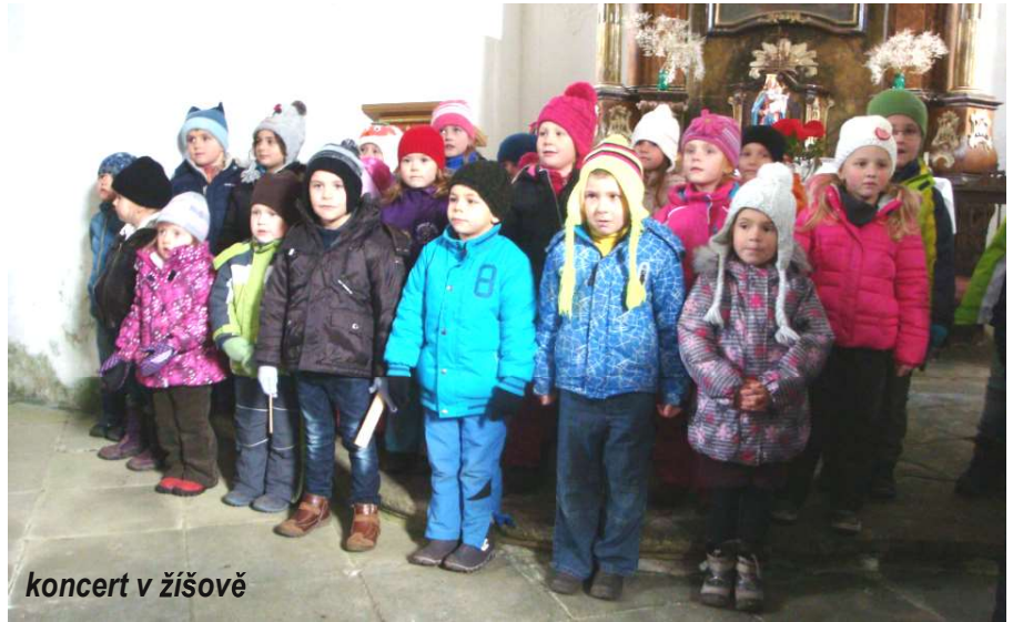
koncert v žišově