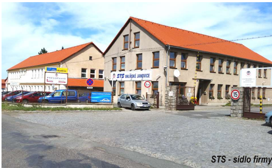
STS - sídlo firmy

Firma se řadí mezi strojírenské firmy, které mají v posledních letech stabilní výrobní program a počet zaměstnanců (kolem 60). Od svých obchodních partnerů má kladné reference na dodávané výrobky a splňuje náročné požadavky především na kvalitu a termíny pro tuzemské a zahraniční zákazníky. Za poslední roky společnost vytváří pravidelně zisk a úměrně ke svým možnostem ve finanční oblasti rozvíjí svoji výrobní základnu (rok 2014 patřil opět k úspěšnějším rokům firmy, dosaženo tržeb 80.951 tis. Kč při zisku před zdaněním 4.215 tis. Kč). Co se výše tržeb