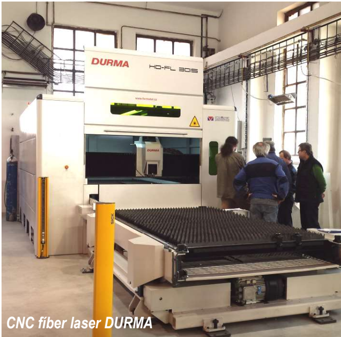
CNC fiber laser DURMA