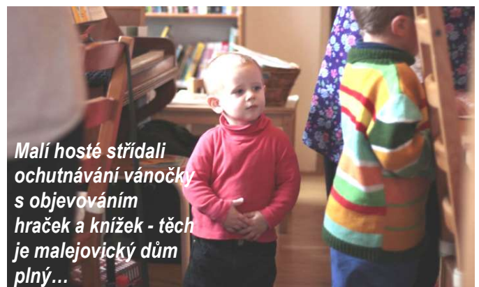
Malí hosté střídali ochutnávání vánočky s objevením hraček a knížek - těch je malejovický dům plný...