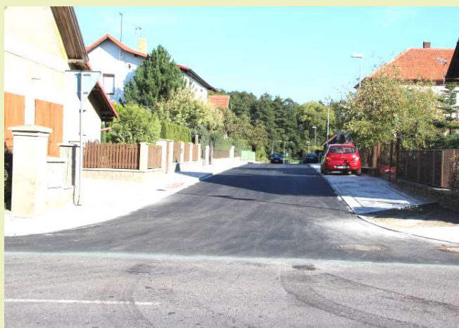
Ulice Máněsova v Uhlířských Janovicích během oprav a po rekonstrukci.