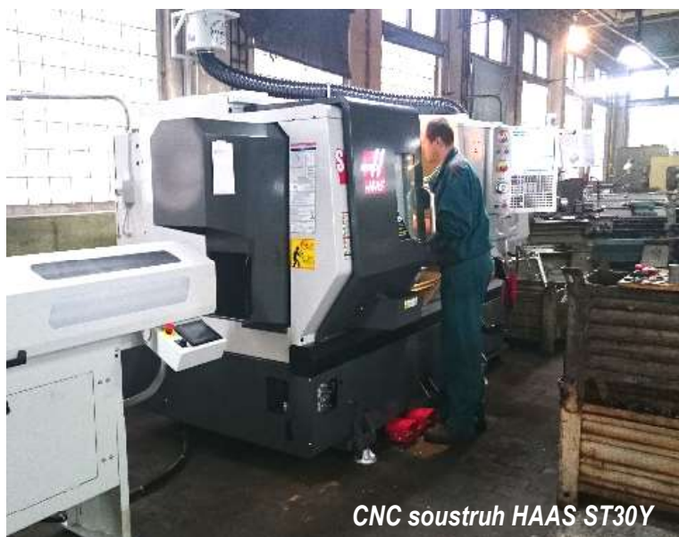
CNC soustruh HAAS ST30Y

V roce 2012 společnost realizovala za přispění dotačních prostředků Evropské Unie v rámci Operačního programu Podnikání a inovace - program ICT v podnicích