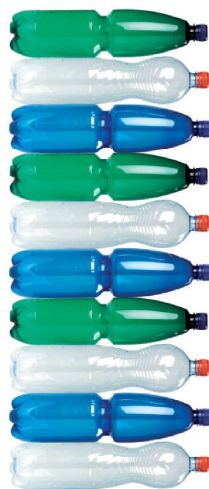
nesešlapané PET lahve 10 ks