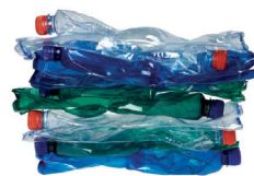
sešlapané PET lahve 10 ks