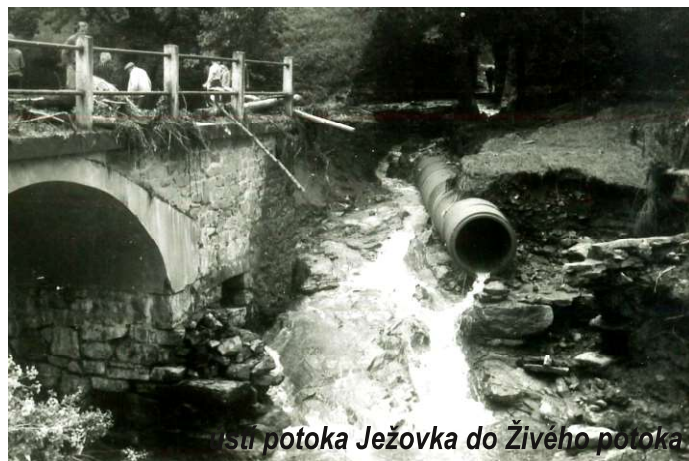
ústí potoka Ježovka do Živého potoka