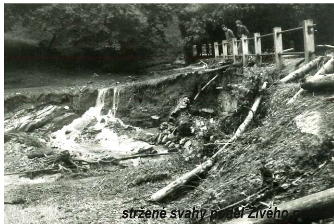
stržené svahy podél Živého potoka