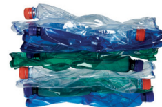
sešlapané PET lahve 10 ks