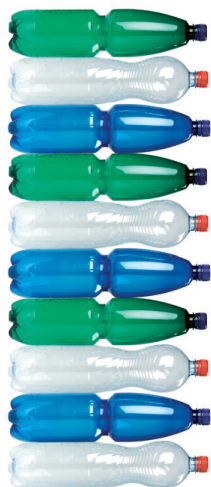
nesešlapané PET lahve 10 ks