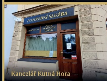
Kancelář Kutná Hora