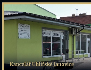
Kancelář Uhlířské Janovice