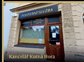
Kancelář Kutná Hora